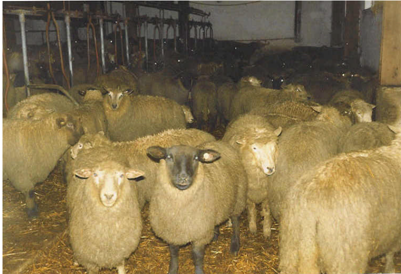
„Das Schweigen der Lämmer auf dem Weg zur Schlachtbank“

Der Tierschutzverein Kirchheimbolanden wird sich regelmäßig vorort zeigen, damit der Betreiber des Schlachthofes weiß, dass wir nicht „schlafen“, sondern in dieser Angelegenheit am Ball bleiben! Vor allem am nächsten Opferfest im Januar 2006.